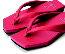
RINK-004 【MENS】 スムース革/レッド ¥19,800(税込)