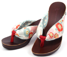
KCL-10 Fピンク/ティール ドット・赤 ¥16,280(税込)

ヒールの高さは4.5cmと6.5cm サイズは足のサイズに応じて5 種類に分かれています