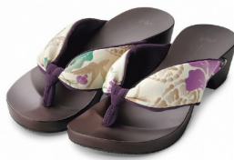
KTW-15 藤と蝶々/スカー 紫・紫 ¥15,180(税込)