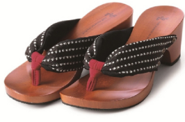
KC-01 ドット黒/黒・ワイン ¥16,280(税込)